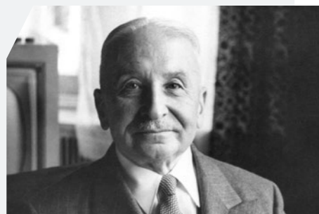
Ludwig von Mises, österreichischer Ökonom

« Wir sehen, dass eine Regierung sich immer dann genötigt sieht, zu inflationistischen Massnahmen zu greifen, wenn sie den Weg der Anleihebegebung nicht zu betreten vermag und den der Besteuerung nicht zu betreten wagt. »