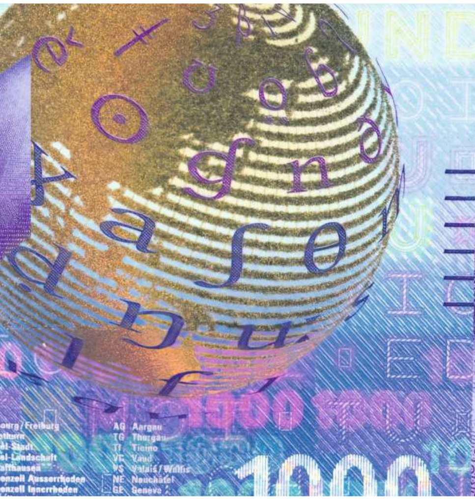
Besten Währungen der Welt.