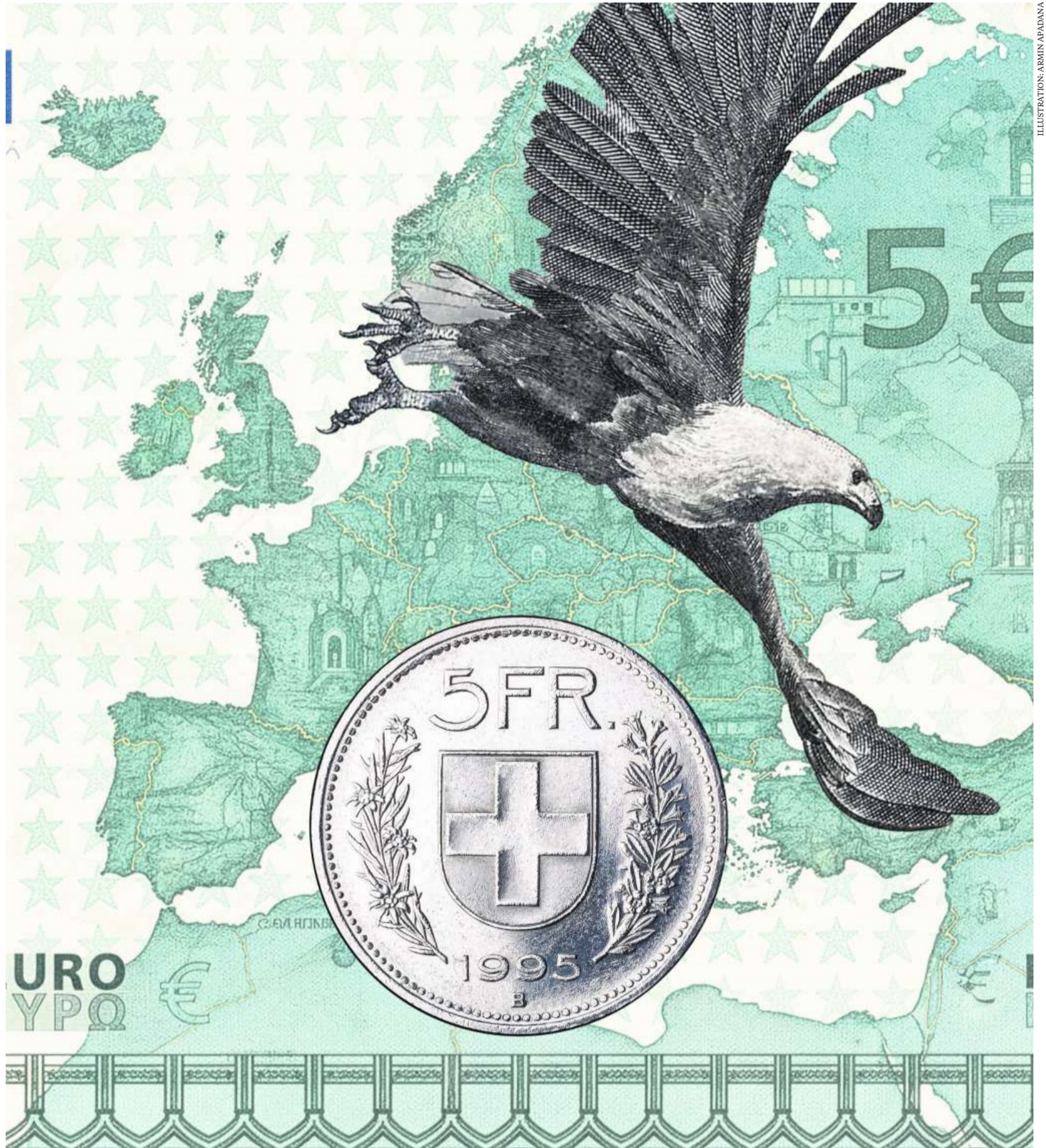
Einst Inbegriff der Stabilität, heute unter Druck – sogar der US-Dollar verliert an Terrain.

Jürg Zulliger, verantwortlich für diese Beilage