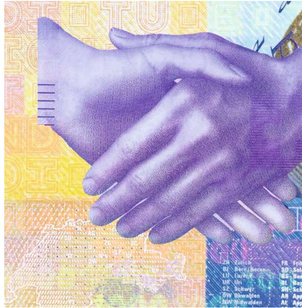
Im globalen Währungsgefüge verschieben sich die Gewichte: Der Franken gilt als eine der stabilsten

Globale Krisen, die den Franken zu einer gesuchten Währung machen, gibt es praktisch immer.